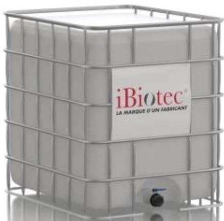
1000 l-es GRV tartály