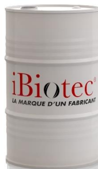
200 l-es hordó