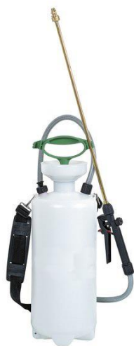
Alacsony nyomású permetezőgépek vízzel történő öblítéssel